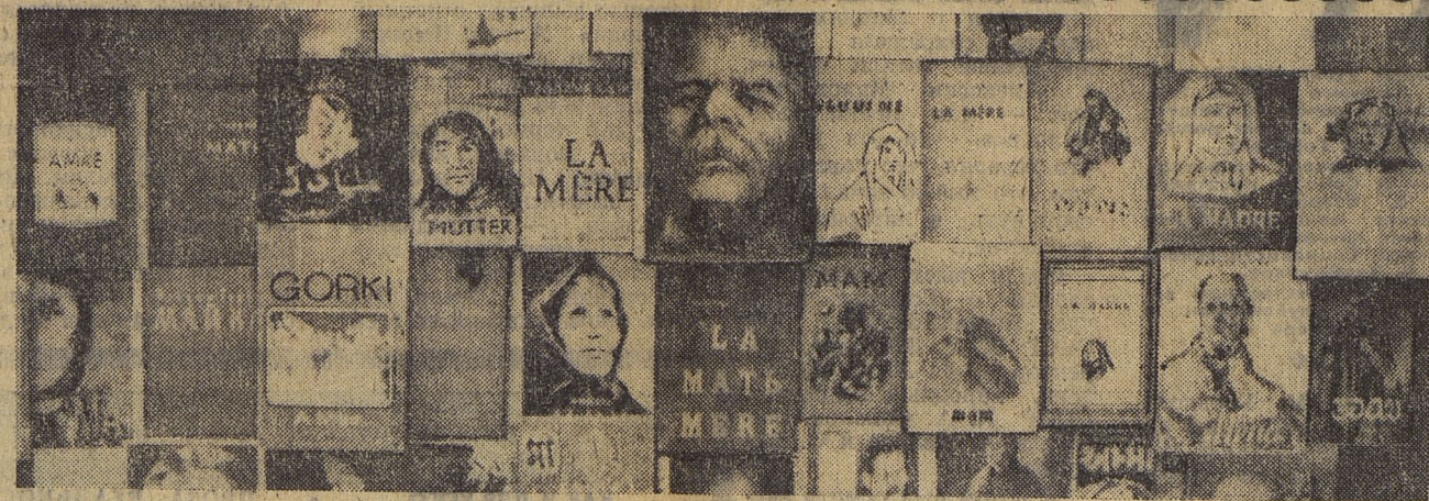
«МАТЬ». Эту книгу читают во всем мире. (Фрагмент экспозиции в Литературном музее А. М. Горького)

С удивительным пристрастием, мудро, терпеливо, с пристальным и постоянным вниманием подходит Горький к людям и учит этому читателя. На небольшом повествовательном пространстве умел он через наносные, случайные, пошлые, будничные в человеке проникнуть к подлинному, ценному, значимому. Итак, найти в каждом таланте, может быть, незаметным самим обладателем этого таланта, неизвестным, окружающим, и сохранить это драгоценное качество челове-