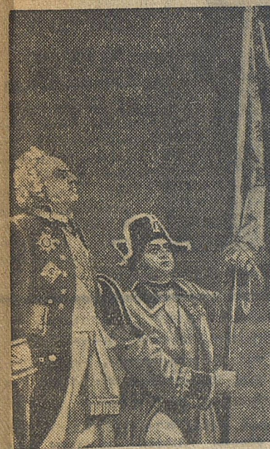
Опера «Суворов» в Казахском академическом оперном театре (Алма-Ата). Официальная сцена — кланья Багратона у суворовского знамени.