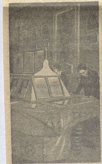
На выставке «Защита Родины в художественной литературе», организованной Государственным литературным музеем. Раздел «Писатели-патриоты».

Группа сотрудников библиотеки составила указатель произведений Горького, произведений Ленина и Сталина о писателе, а также многочисленную литературу о творчестве Горького.