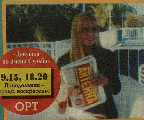
«Девушка по имени Судьба»