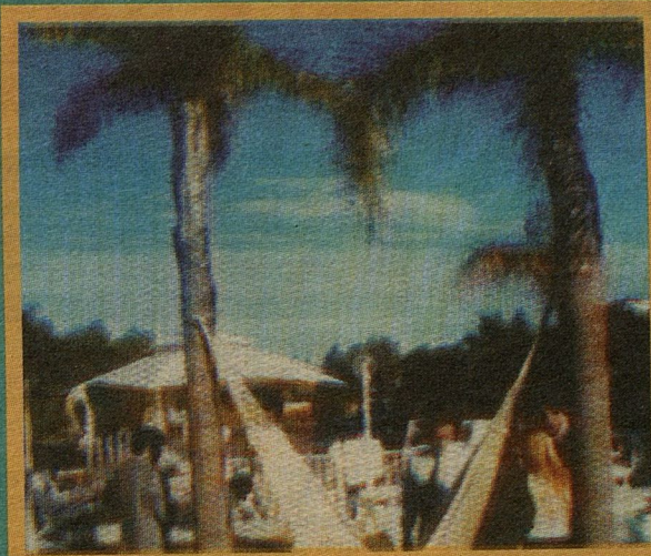
Уголок «рая» Гресии КОЛМЕНАРЕС

Перевел с испанского журналист Виктор КУЗЬМИН Материал к печати подготовила Вера ЧЕРНЯЕВА Россия — Бразилия — Аргентина — Россия