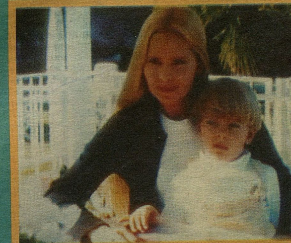
Мама и сын никогда не расстаются

P.S. Эти кадры сделаны с видеокассеты, на которую было записано интервью.