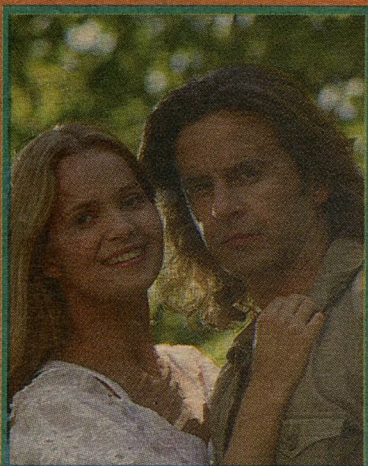
♥ С Освальдо ЛАПОРТОМ в сериале «Девушка по имени Судьба»