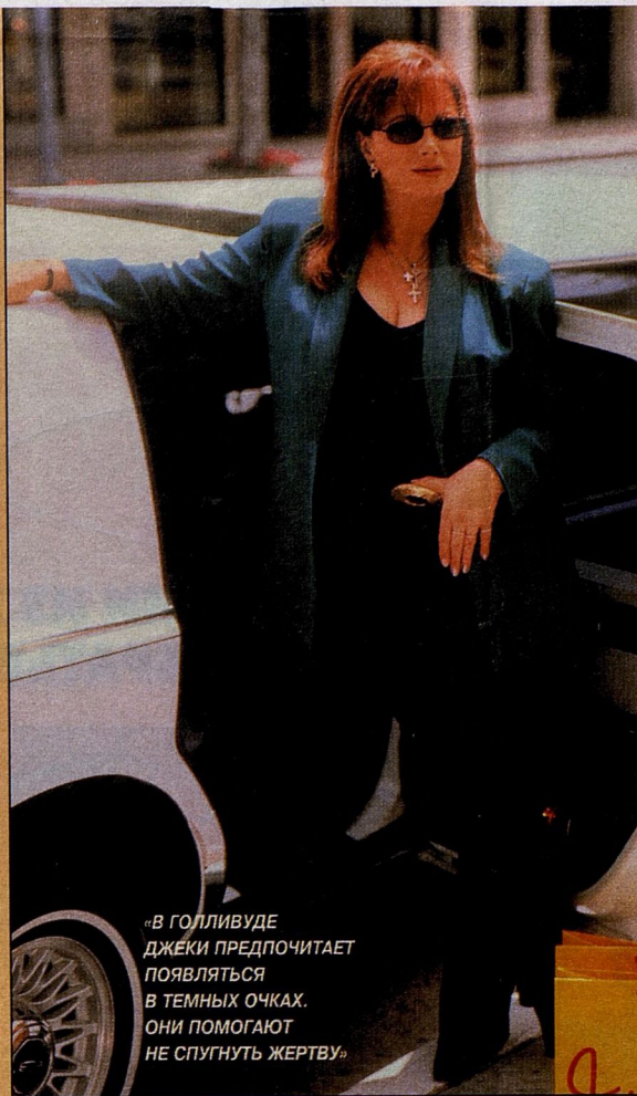
«В ГОЛЛИВУДЕ ДЖЕКИ ПРЕДПОЧИТАЕТ ПОЯВЛЯТЬСЯ В ТЕМНЫХ ОЧКАХ. ОНИ ПОМОГАЮТ НЕ СПУГНУТЬ ЖЕРТВУ»

трагивается к еде до вечера. «Это мои самые счастливые часы», — утверждает она. Любопытные репортеры не раз задавали ей вопрос, как 56-летняя писательница ухитряется сохранять та-