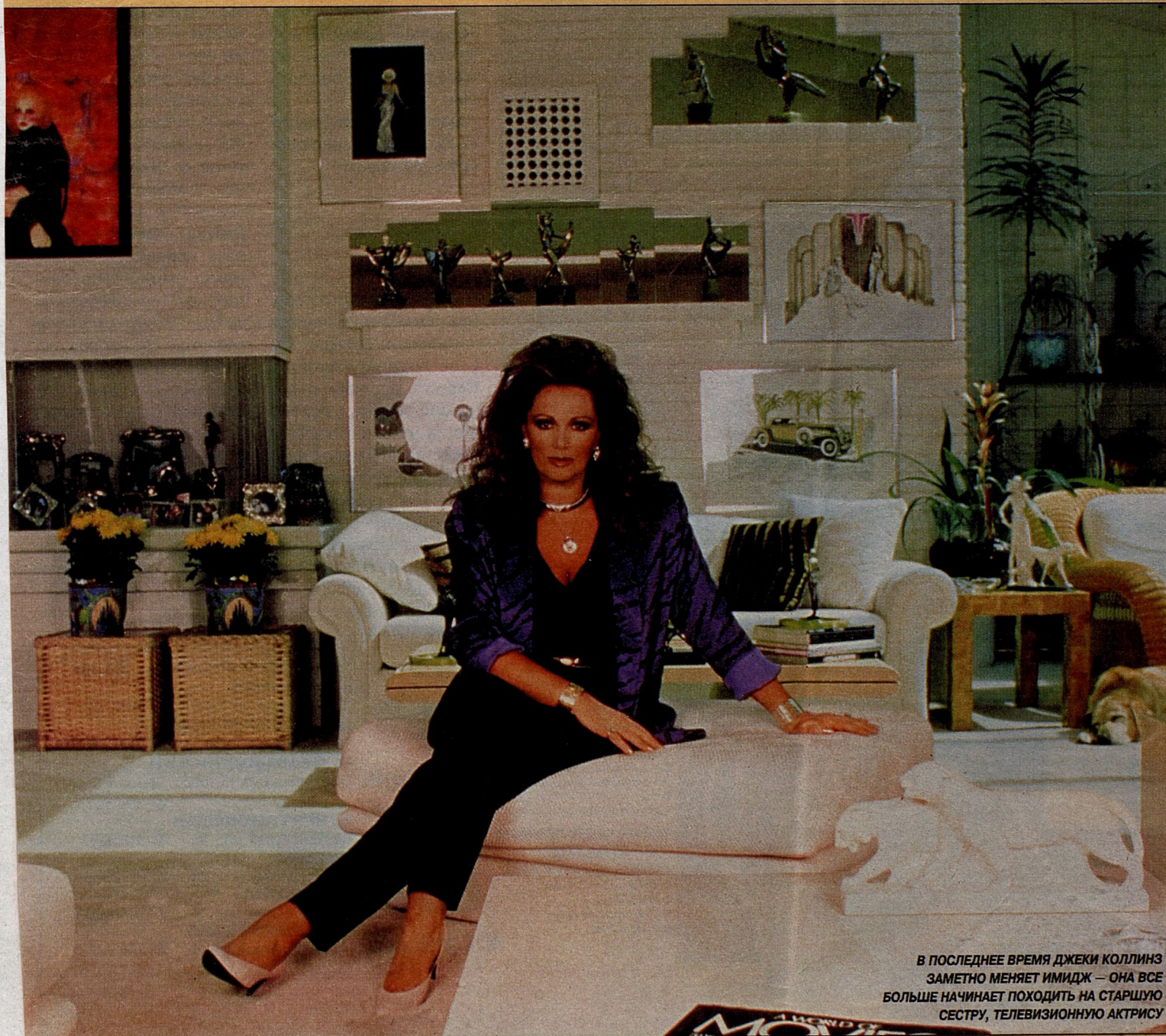
В ПОСЛЕДНЕЕ ВРЕМЯ ДЖЕКИ КОЛЛИНС ЗАМЕТНО МЕНЯЕТ ИМИДЖ — ОНА ВСЕ БОЛЬШЕ НАЧИНАЕТ ПОХОДИТЬ НА СТАРШУЮ СЕСТРУ, ТЕЛЕВИЗИОННУЮ АКТРИСУ

P.S. Любопытно, но давнее соперничество сестер не прекращается и по сей день. Джеки уже активно снимается в телесериалах, поставленных по ее романам. В свою очередь, на счету Джоан уже три книги мемуаров и три романа.