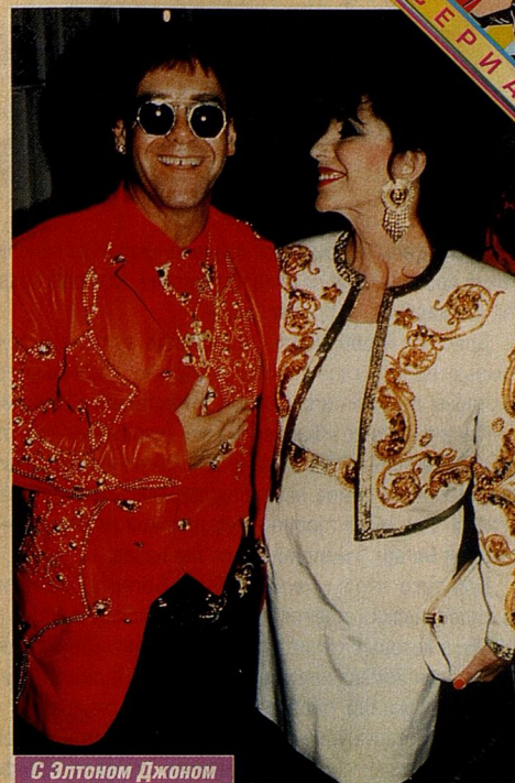
С Эритоном Джоном

Возник даже вопрос о разрыве контракта. Чтобы избавиться от услуг актрисы без скандала с ее стороны, продюсеры попросили сценаристов в очередной серии устроить ей «автокатастрофу с летальным исходом». Но умереть Алексис Кэррингтон не дали возмущенные зрители. Они хотели видеть ее живой.