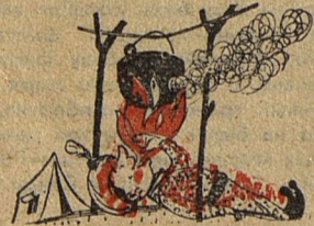
Иллюзионист на привале. Рисунок К. Невлера.