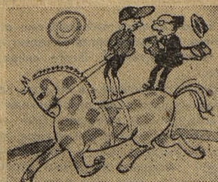
— Как вы достигли такого мастерства? Рисунок В. Соловьева.