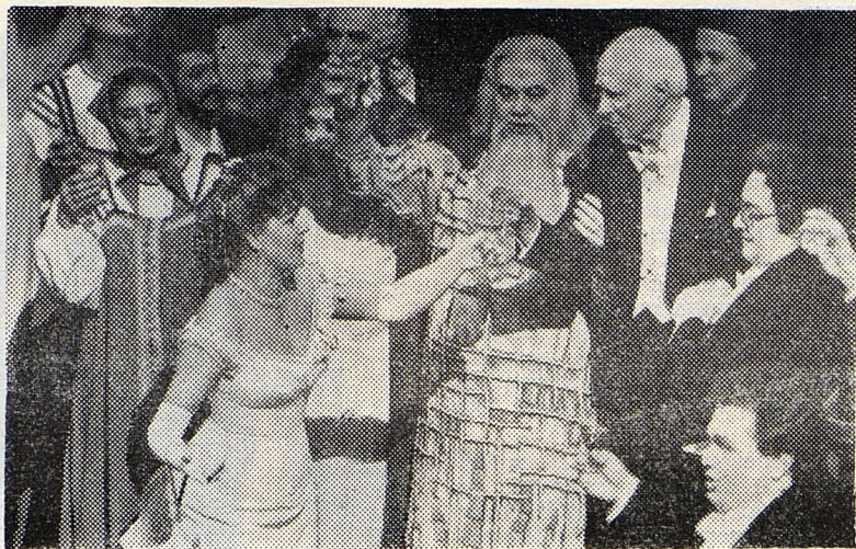
На снимке: И. С. Козловского приветствуют артисты Боль-