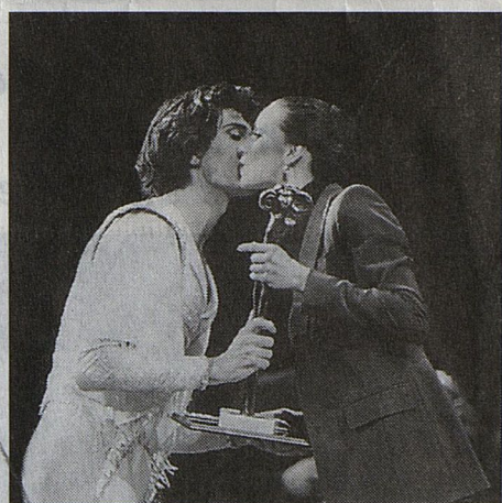
М. Александрова получает приз из рук Н. Цискаридзе.