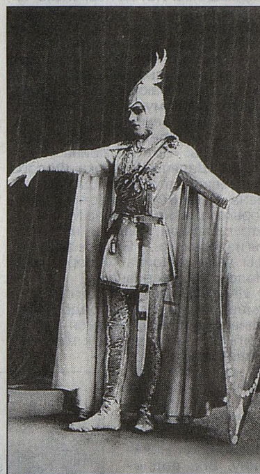
Лозингин. 1926 год.

Опера — особое проявление творческого стремления человека воссоздать многообразную картину мира. Опера обладает своими строгими закономерностями, нарушение которых приводит к дисгармонии и неестественности. Опере — оперное. Драматургия образа в спектакле должна целиком идти от музыки. Опера — условный, поэтический жанр; поверхностное, бытовое правдоподобие несовместимо с его природой, а примитивное понимание того, что на сцене современно, порождает дисгармоничное и уродливое зрелище.