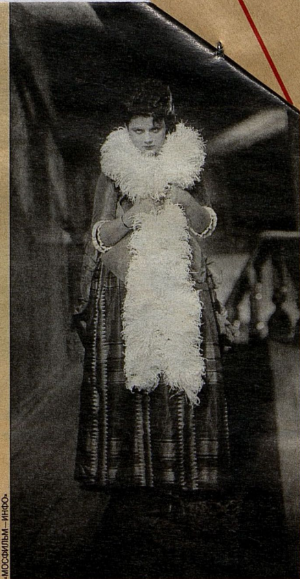
Сергеева в фильме «Пышка»

Как и большинство звезд русской оперы, Козловский на сцене выглядел аристократом, а происходил из простых. Его родители крестьянствовали в селе Марьяновка, в 50 верстах от Киева. Ивасику же прочили иную судьбу и в восемь лет отправили в бурсу, в киевский Златоверхий Михайловский монастырь. Оттуда был один путь — в священники, но учитель музыки все твердил: «Об архиерейском сане не помышляй. Твое призвание в другом. Ведь прихожан в нашем храме прибавилось, когда тебя на клиросе петь поставили!» Кстати, даже став солистом придворного театра страны атеистов, Козловский по великим праздникам пел в хоре московской Воскресенской церкви в Брюсовском переулке.