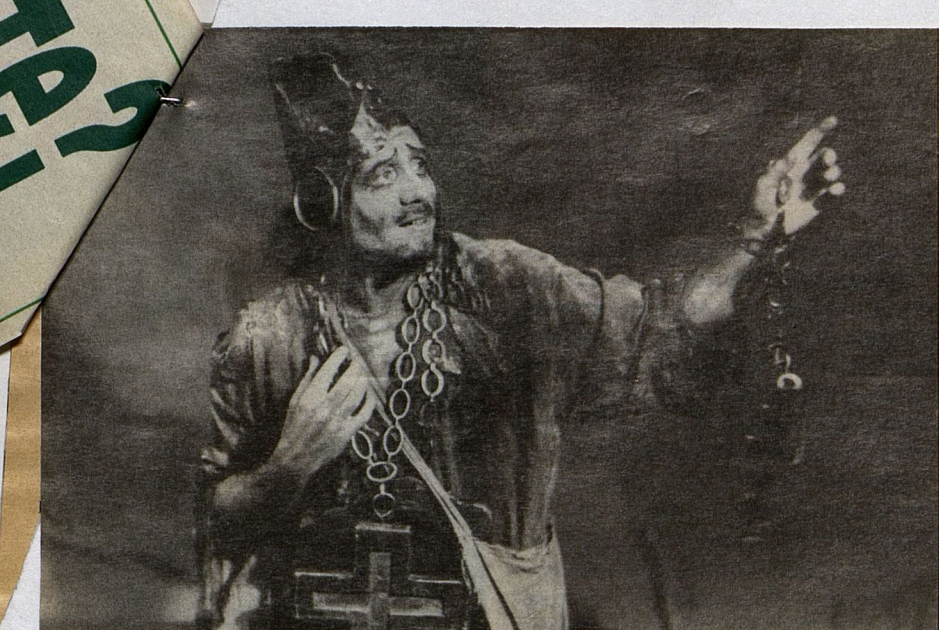
Иван Семенович в знаменитой роли Юродивого (опера «Борис Годунов»)

манящей прелести, которую позже нарекут сексапильностью, в ней было столько, что хватило бы на десяток красавиц! И вот такая-то богиня приехала в Крым, в Дом отдыха «Рабис», где каждое лето отдыхал Иван Семенович Козловский — морские ингаляции для укрепления голосовых связок ему порекомендовал сам нарком здравоохранения Семашко.