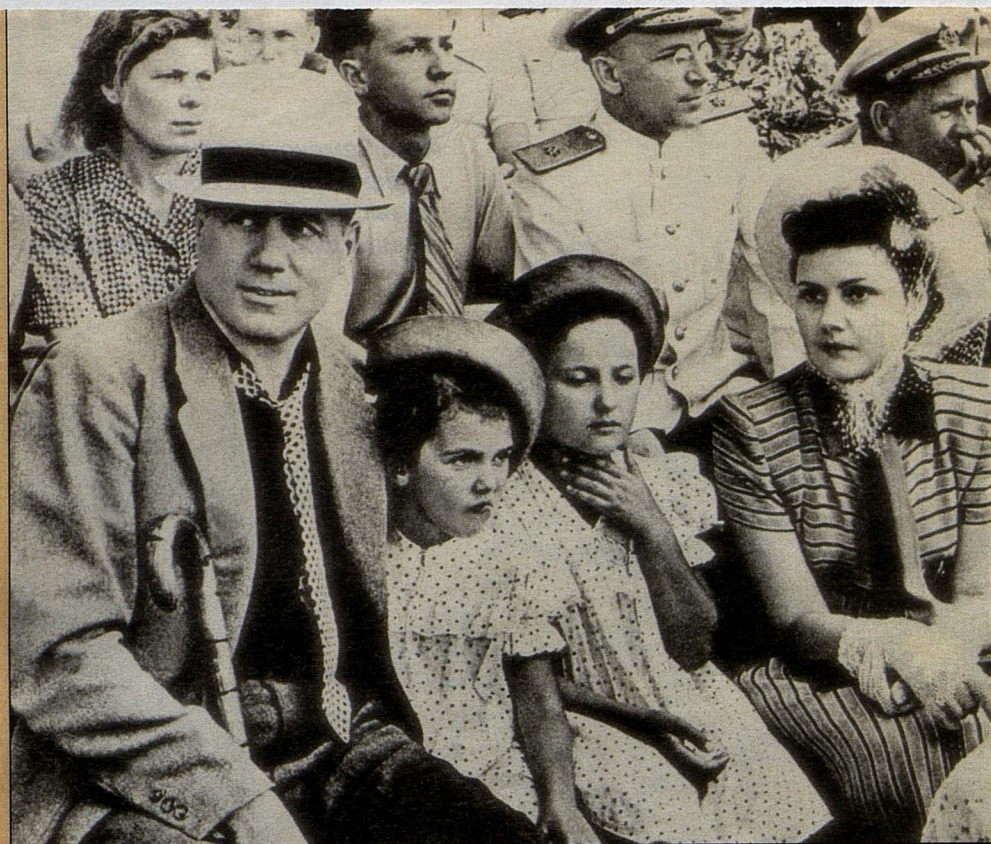
Козловские всей семьей на Московском ипподроме

Его любили не только за голос уникального тембра, уникальных возможностей, но и за то, что никогда нельзя было заранее знать, что сделает Козловский из той или иной роли. Недаром самой знаменитой в его исполнении стала партия Юродивого в «Борисе Годунове», раньше считавшаяся мелкой и проходной. Иван Семенович любил поэкспериментировать. Он то «осовременивал» арии: «Откройте, а то сейчас объявят воздушную тревогу», — пел в 1942 году в «Севильском цирюльнике». То вмешивался в режиссуру: в «Риголетто» знаменитое «Сердце красавиц» с некоторых пор стал заканчивать, уйдя за кулисы, — режиссер сердился: «О том, что вы берете ре-бемоль тре-