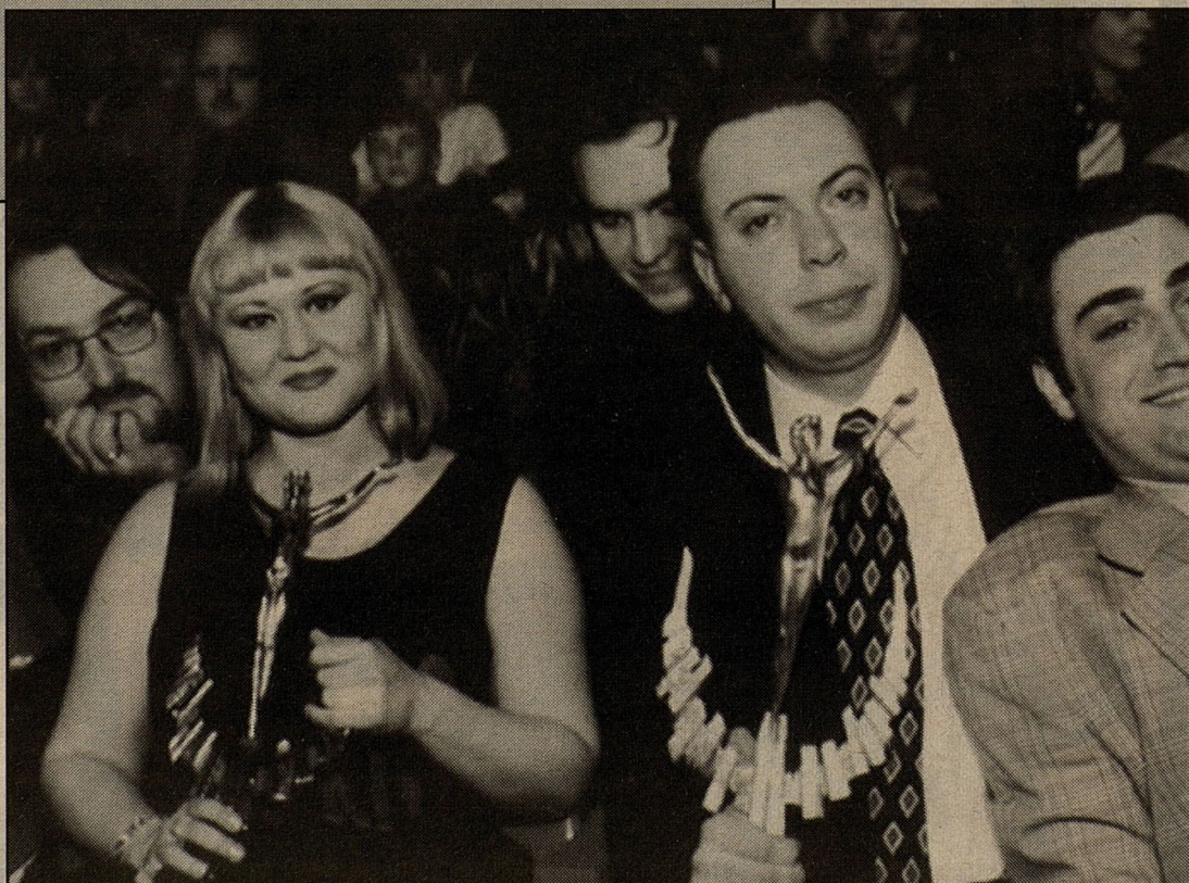
1999 год. Вручение премии Попова.

«Я недавно вычитал чудную фразу: «Только мелкие, незначительные люди реагируют на мелкие, незначительные статьи». В конечном счете, понятно, все это – шелуха, тлен, который исчезнет, а дело, которое ты делаешь, останется. Но я еще не дошел до того состояния дзен-комфорта, в котором можно с закрытыми глазами пропускать мимо ушей невероятное количество оскорбительных и злых отзывов».