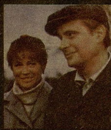
Кадры из к/ф «Осенний марафон»

Г.ДАНЕЛИЯ. Во время работы я называл главного героя картины Бузыкина «героем нашего времени». Это, конечно, не на сто процентов серьез, но и не только шутка.