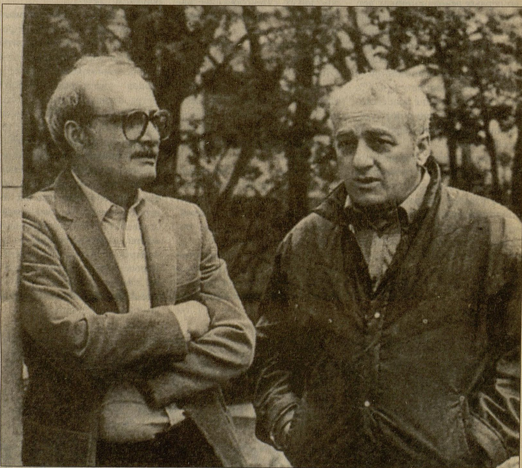
Георгий Данелия с Резо Габриадзе думают над сценарием.

Конечно, Данелия пишет и о своем детстве, о родителях, о Грузии... Но все дорожки обязательно сходятся на съемочной площадке, в рамке кадра, который вмещает все, что память вместить не сумела. Читайте фильмы, смотрите книги.