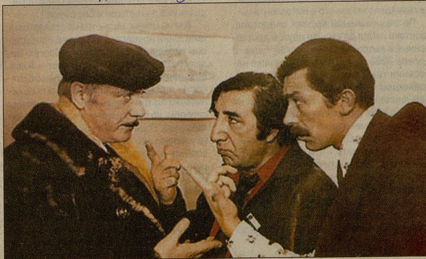
Такие люди, как Дanelия, прославляют республику (кадр из фильма «Мимино»).