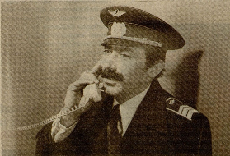
«Ларису Иванну хачу!» — «Мимино» с Бубой Кикабидзе разошелся на цитаты

В течение двухчасовой попытки интервью («Журналистов не пускаю и никаких исключений больше не делаю!») права на диалог заслу-