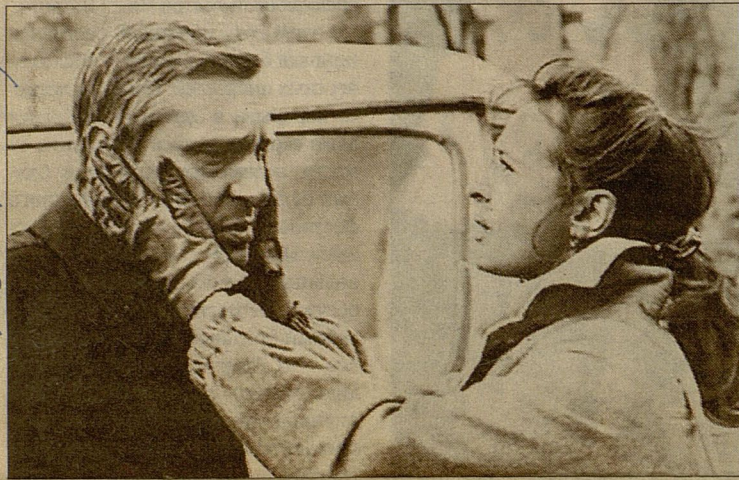
Культурные герои «Осеннего марафона» и «Кин-дза-дзы» — Марина Неёлова и Олег Басилашвили; Евгений Леонов и Юрий Яковлев