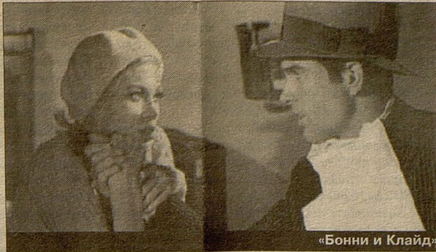
«Бонни и Клайд»