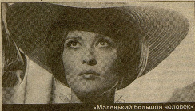
«Маленький большой человек»

— О моих блистательных партнерах и режиссерах? С удовольствием! Сидни Поллак — глубокий, истинный художник. Николсон — большой выдумщик, мы с ним настоящие друзья. Рядом с ним съемки превращаются в настоящее веселое шоу. Рэдфорд, напротив, замкнут. Весь внутри. Многим с ним трудно общаться. Вместе с тем его отличают острый ум и наблюдательность. И еще: ему небезразличен путь, по которому движется кино. Неслучайно он стал инициатором фестиваля в Санденсе. Уоррен Битти — ныне классик, а тогда был новичком, как и я. Мы вместе набивали шишки. Джордж Скотт — фантастический актер. Никогда не читал сценарий, он всегда валялся у него в чемодане. Но начиналась работа над сценой — и он уже все знал,