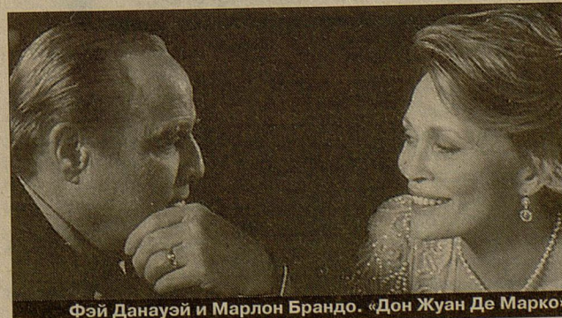
Фэй Данауэй и Марлон Брандо. «Дон Жуан Де Марко»