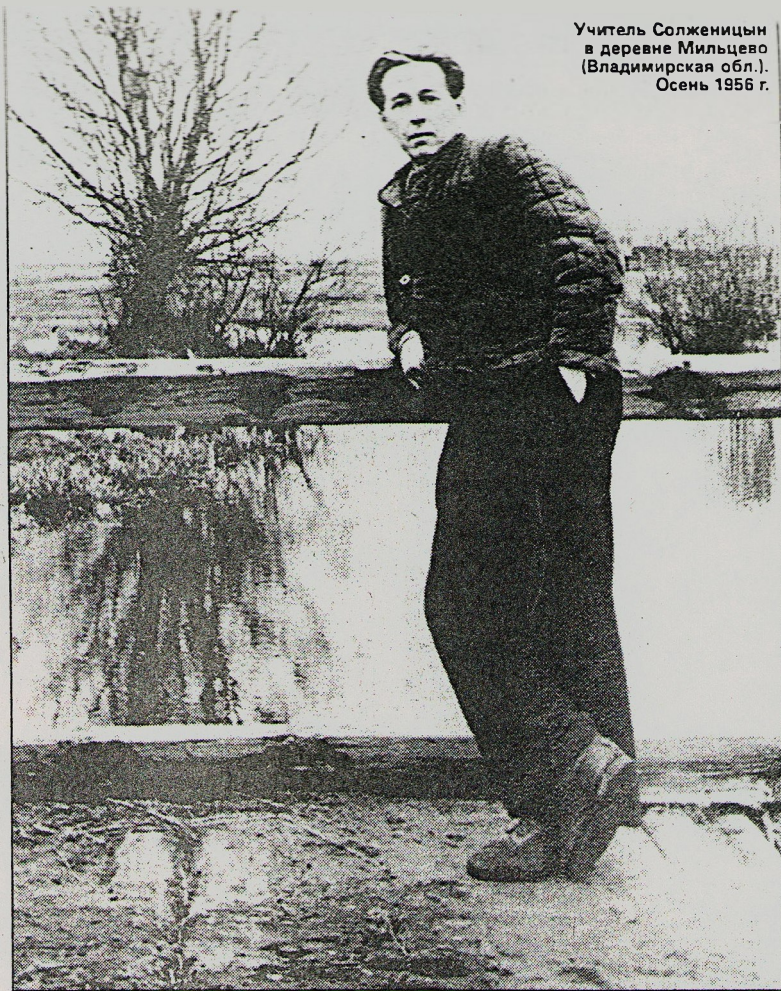
Учитель Солженицын в деревне Мильцево (Владимирская обл.). Осень 1956 г.

— Знаете, у каждого человека есть сферы жизни, о которых не рассказывают даже и биографу. Я стараюсь держаться границ своей профессии. Иногда Александр Исаевич готов что-то рассказать мне лично, но не для печати. Тогда я просто выключаю магнитофон.