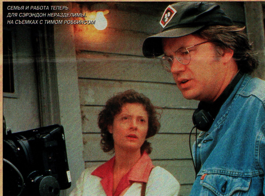
СЕМЬЯ И РАБОТА ТЕПЕРЬ ДЛЯ СЭРЭНДОН НЕРАЗДЕЛИМЫ. НА СЪЕМКАХ С ТИМОМ РОББИНСОМ

ки. «Я чувствовала себя очень уязвимой и беззащитной. Все, что мне оставалось, — это «светиться внутренним светом».