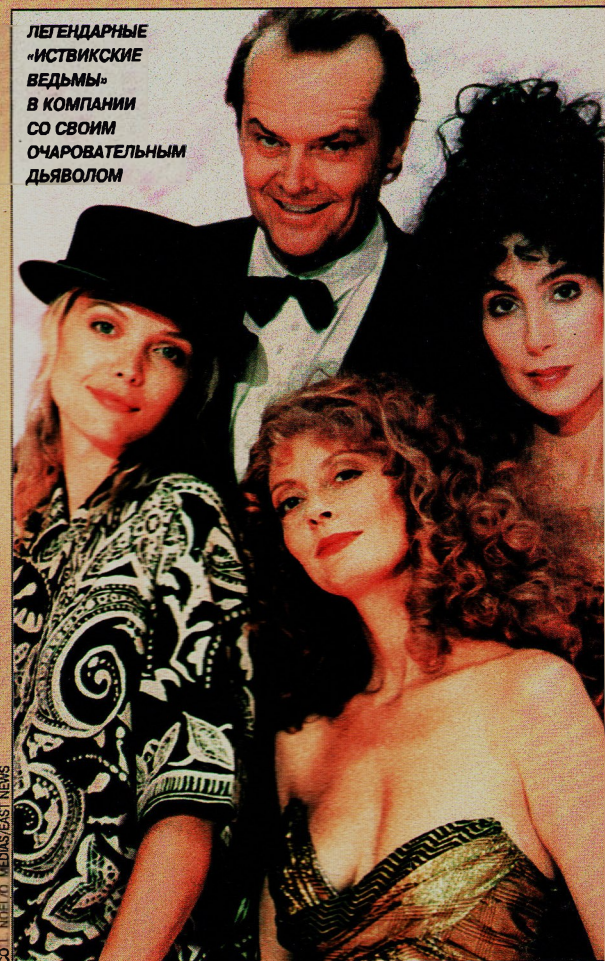
COPIED BY MEDIANEAST NEWS

ЛЕГЕНДАРНЫЕ «ИСТВИКСКИЕ ВЕДЬМЫ» В КОМПАНИИ СО СВОИМ ОЧАРОВАТЕЛЬНЫМ ДЬЯВОЛОМ