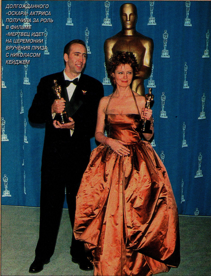
ДОЛГОЖДАННОГО «ОСКАРА» АКТРИСА ПОЛУЧИЛА ЗА РОЛЬ В ФИЛЬМЕ «МЕРТВЕЦ ИДЕТ» НА ЦЕРЕМОНИИ ВРУЧЕНИЯ ПРИЗА С НИКОЛАСОМ КЕЙДЖЕМ

Но в один прекрасный день Луи Маль огорошил ее признанием, что собирается жениться. Не на ней. Ему очень жаль, и, конечно, это не означает, что они не будут больше работать вместе... Весь боевой дух актрисы обратился на то, чтобы не сойти с ума от отчаяния. Ей не хотелось никого видеть, не было сил оставаться наедине с собой — и Сьюзен с головой погружилась в работу. Актриса принимала любые предложения. Телесериал — хорошо, пусть будет телесериал. Озвучить мультфильм — пожалуйста. Ей стали все больше доставаться роли одиноких и не очень счастливых женщин. Потом в ее жизни все же стали возникать роман за романом — но ни один из них она не принимала всерьез. Некоторое время она жи-