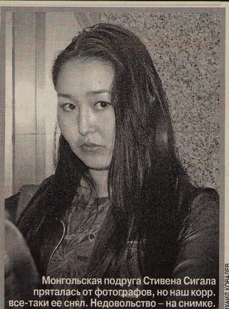
Монгольская подруга Стивена Сигала пряталась от фотографов, но наш корр. все-таки ее снял. Недовольство — на снимке.

Правда, в подлинности "фенечек", которые украшали тело Сигала, можно было не сомневаться. До актерской карьеры он долго жил в Японии, с детства начал заниматься айкидо и вообще свой человек в странном восточном мире. Тут же выяснилось, что любовь ко всему восточному распространяется и на личную жизнь Стивена. В Москву он приехал со своей новой подругой — молоденькой монголкой. Как стало известно "МК", девушка уже давно является пассией актера. До развода Сигала с его второй женой она работала в доме актера по хозяйству.