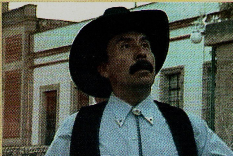
ПОНЕДЕЛЬНИК, СРЕДА—ПЯТНИЦА. 2x2. 15. 05