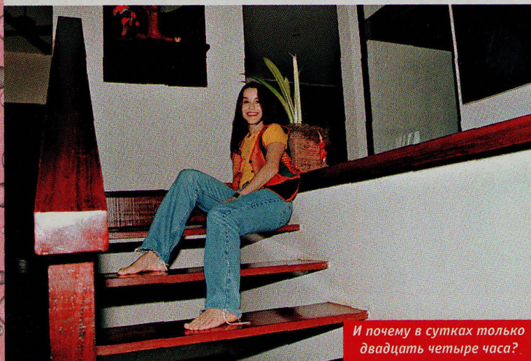
И почему в сутках только двадцать четыре часа?