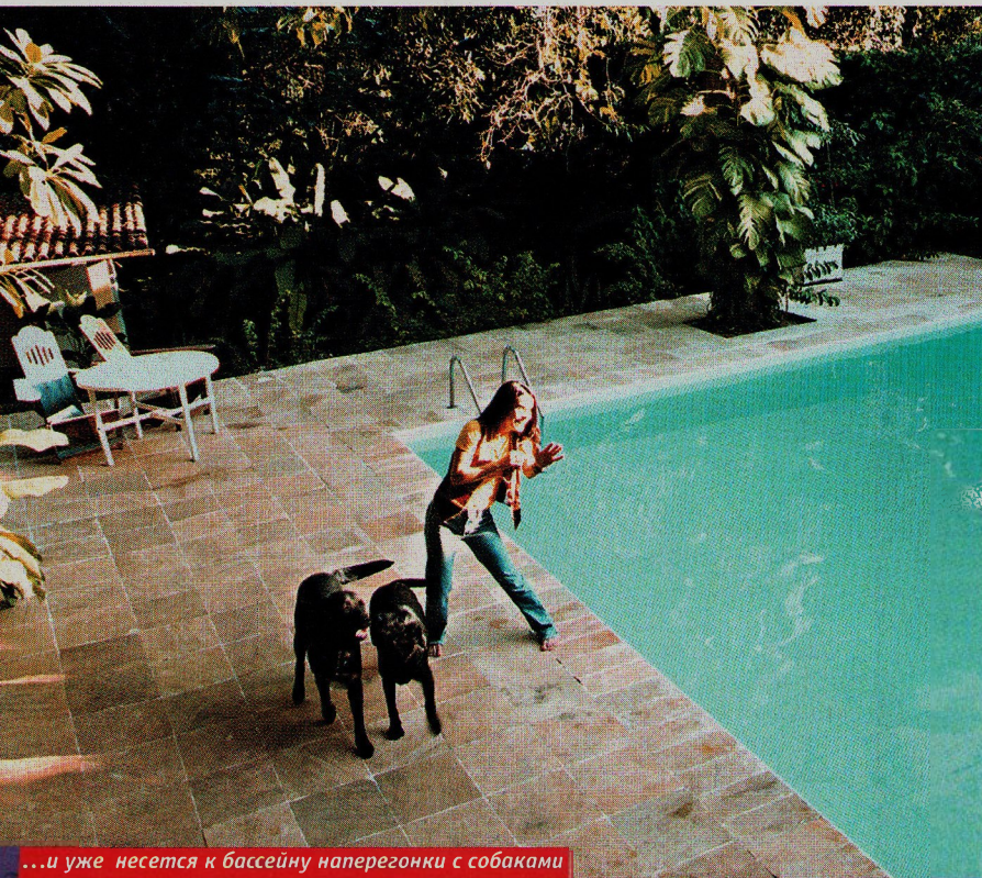
...и уже несется к бассейну наперегонки с собаками

— Я считаю, счастливо. До середины восьмидесятых годов я переиграла множество ролей на телевидении и в кино. Очень много ездила по миру, была, так сказать, послом бразильского искусства. Потом стала осуществлять собст-