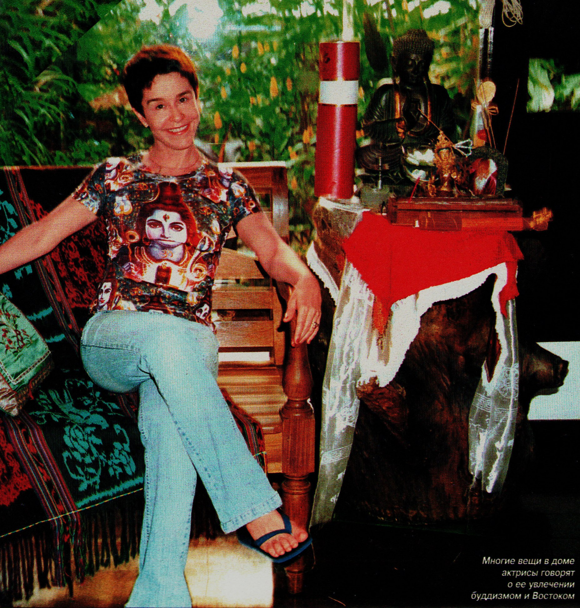
Многие вещи в доме актрисы говорят о ее увлечении буддизмом и Востоком