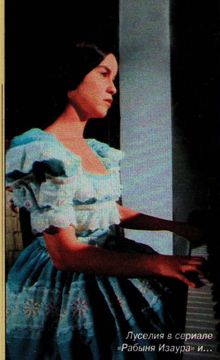
Луселия в сериале «Рабыня Изаура» и...