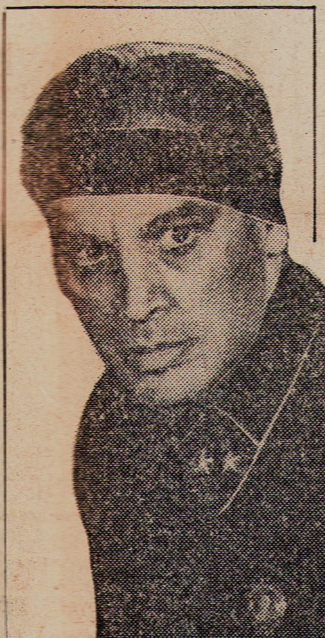
«Фронт». В роли Огнева — В. ЛАНОВОЙ

Вся советская литература стала тогда особого рода важным и грозным оружием. В перерывах между боями солдаты читали стихи Твардовского и Симонова, небольшие, емкие, остро отточенные статьи-памфлеты Эренбурга, очерки и рассказы Шолохова, А. Толстого, Леонова, Катаева. Литература звала бойцов на подвиг во имя Родины, призывала к стойкости и отваге, вдохновляла людей, вселяла новые силы в их души. Исто-