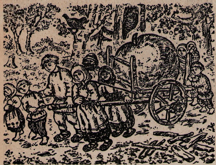
Рис. Ефима ЧЕШНЯКОВА, 1923 г.