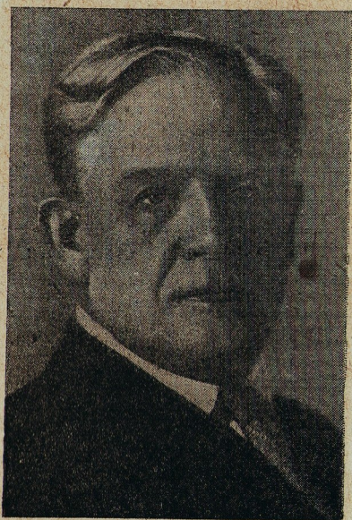
Народный артист СССР П. М. Садовский.

Если и в первых своих опытах (вспоминается Мизгирь в «Снегурочке», 1900, еще более ранний Глумов) П. Садовский был хорошим актером репертуара Островского, то позднейшие его работы, как Дубровин («Воевода»), Миловидов («На бойком месте»), Беркутов («Волки и овцы»), свидетельствуют о таком понимании особенностей драматургического письма Островского, о таком средстве актера с основными устремлениями драматурга, что Садовского по справедливости нужно включить в небольшое число превосходных мастеров, чья работа в театре Островского может служить школой для молодых поколений актеров.