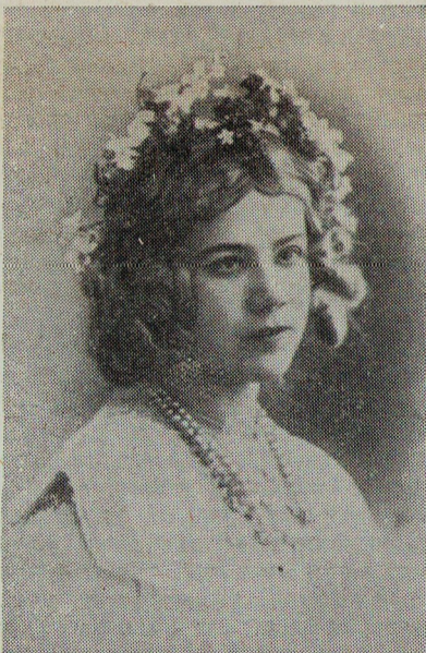
Е. М. Садовская в роли Снегурочки.

Сегодня, в день 100-летнего юбилея Садовских, особенно важным для нас становится определение путей, ведущих наш театр к укреплению лучших традиций прошлого, тех традиций, которые помогают нам строить великое искусство страны торжествующего социализма.