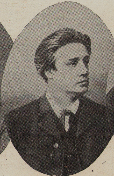
Михаил Провыч Садовский.