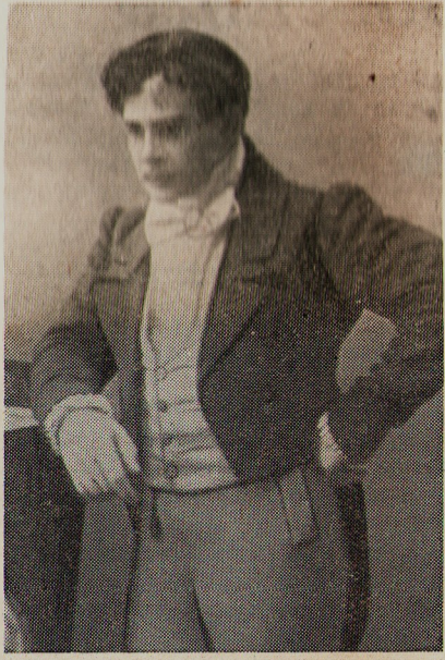
П. М. Садовский-младший в роли Чацкого («Горе от ума»)