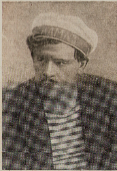
П. М. Садовский-младший в роли Кошкина («Любовь Яровая»)