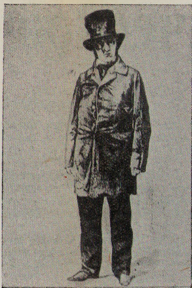
П. М. Садовский-старший в роли Расплюева.

его преобладал не быт, а больше лирика, романтика. С большим, солидным успехом он сыграл Чацкого, причем роль у него непрерывно росла и совершенствовалась. Но было маленькое «но» в творчестве Прова Михайловича в молодые годы... Да не посетует на меня Пров Михайлович — это некоторая самолюбленность, самолюбование. В сильных местах иногда изменял голос — он охрипал. И вот, в свои зрелые годы этот талантливый артист не только не сдал, а с каждой новой ролью растет, углубляет свое творчество, придает большую характерность своим образам и становится уже во многих ролях в ряд со своими знаменитыми родителями. Благодаря тому, что Пров Михайлович бросил курить, голос стал чище, сильнее и податливее на все модуляции. Нельзя без радости вспомнить его короля Карла в «Кромвеле», Брута в «Юлии Цезаре» Шекспира, где он достигал совершенства по линии классического актера и передавал свою роль с необыкновенной сдержанностью и большим благородством, давая запечатляемую классическую фигуру. Его чудесно вылепленный Филипп в «Дон Карлосе» и, наконец, две последние его роли — Несчастливцев в «Лесе» и Фамусов в «Горе от ума» — ставят его в ряды самых выдающихся артистов нашей сталинской эпохи. И радостнее всего, что он не успокаивается на лаврах, и, чувствуя на себе великую ответственность продолжателя столетней артистической династии Садовских, Пров Михайлович непрерывно растет, совершенствуется и с гордостью и по праву несет имя Садовского.