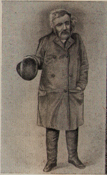
П. М. Садовский-старший в роли Любима Торцова («Бедность не порок»)

атра поняла, что совершилось событие, открывавшее новую эпоху в истории русского театра. «Шире дороги! Правда на сцену идет. Любим Торцов — правда. Воплощенная правда выступила на сцену!» — так, по рассказу И. Ф. Горбунова, встретил демократический зритель 1850-х годов Садовского в комедии Островского. Аполлон Григорьев с большой чуткостью выразил то впечатление, которое выносилось из игры Садовского в «Бедность не порок»: