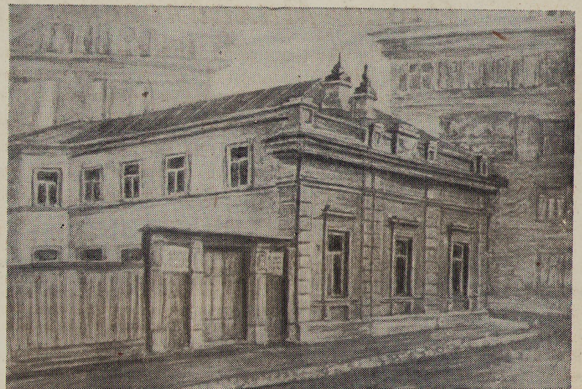
Дом Садовских в Мамоновском переулке в Москве.