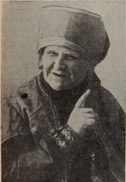
О. О. Садовская в роли няньки Невдиги («Воевода»)

На имени Ольги Осиповны Садовской, как на народном имени великого художника правды, сходились представители всех русских театральных течений последних семидесяти лет. Для Ермоловой и Ленского, этих лучших представителей «Дома Щепкина», имя Садовской было столь же великим именем, как для таких строителей нового театра, как Чехов и Станиславский. Если А. П. Ленский, по его собственным словам, в Садовской видел такую же великую музу комедии, как в Ермоловой—музу трагедии, то К. С. Станиславский называл Садовскую драгоценным алмазом русского театра, самоограничившим себя до бриллианта редкой чистоты и солнечной игры.