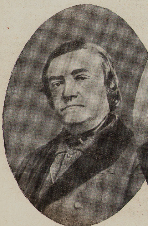
Пров Михайлович Садовский-старший.