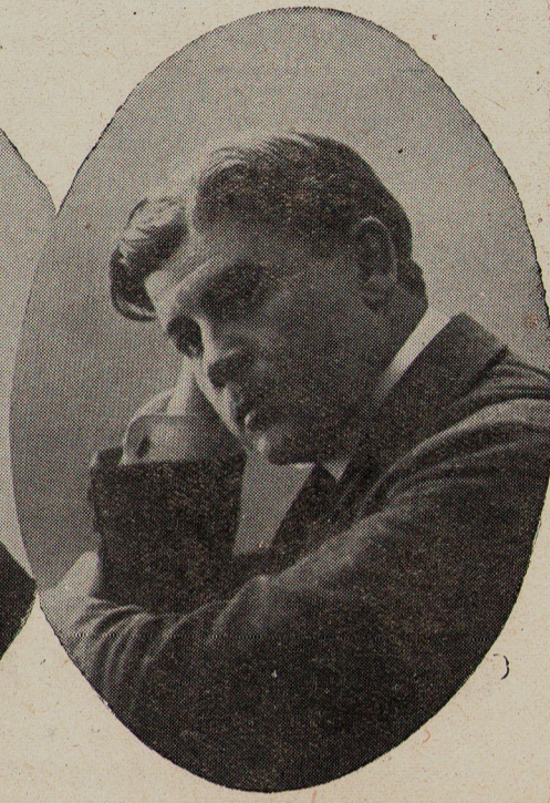
Пров Михайлович Садовский-младший.