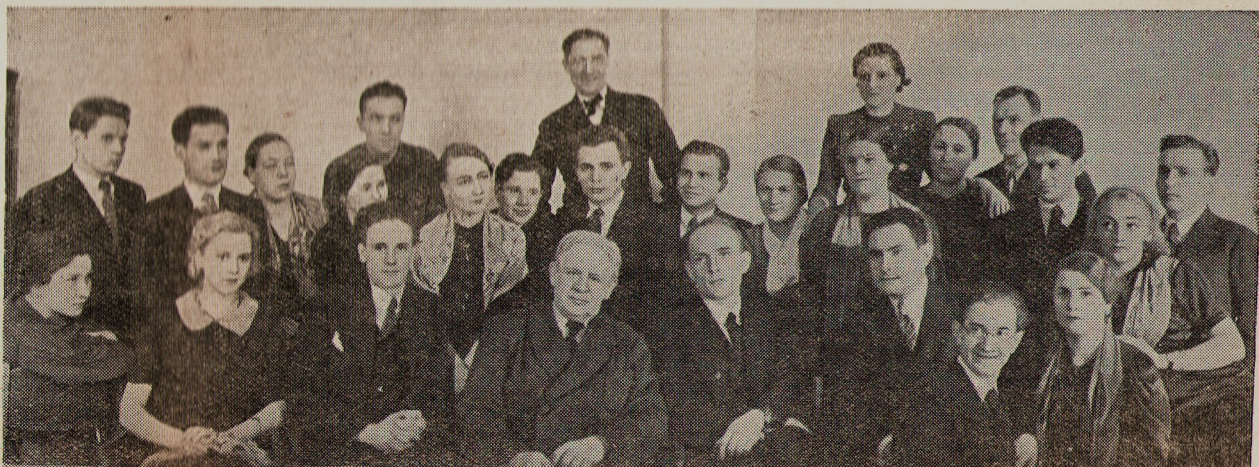
Народный артист СССР П. М. Садовский (в центре) с актерской молодежью Малого театра. Третий слева в первом ряду племянник П. М. Садовского — М. М. Садовский.

В ближайшее время в Российском Театральном Обществе состоится творческий вечер народного артиста Союза ССР П. М. Садовского.