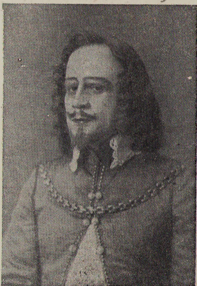
П. М. Садовский-младший в роли короля Карла («Кромвель»)