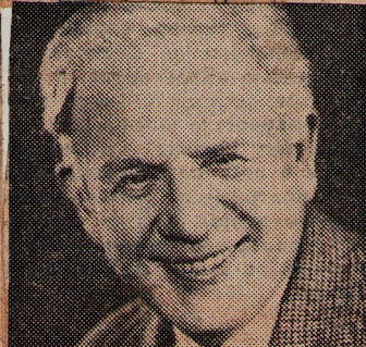
Пров Михайлович II