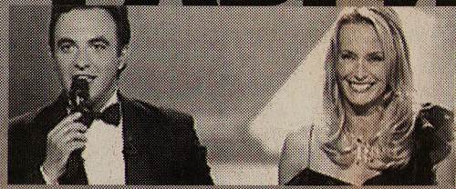
Эстель и Никас — главные звезды "Worldbest".