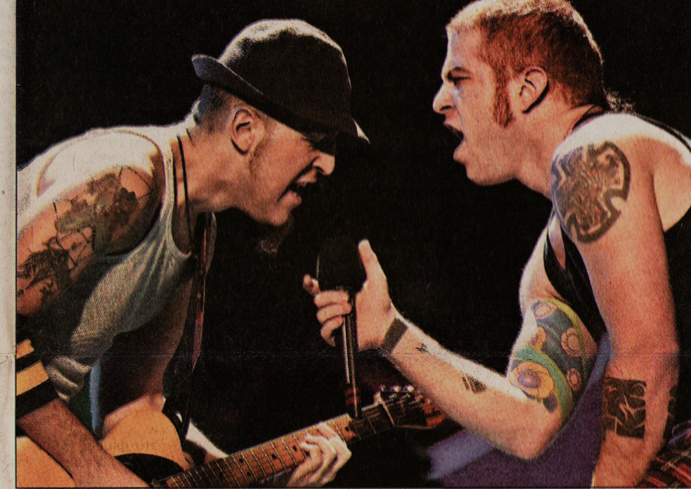
Турки чем-то напоминали отечественный «Ленинград»

великолепная открытая страна, – защищала «неньку» Руслана. Украинские власти счастливы. Руслана поздравил не только президент, но и вся его семья. Киев получил пир на миллиард долларов – но только оценивается реклама от проведения «Евровидения». Будем надеяться, что от украинских шлопот кусочек рекламы перепадет и нам. Может быть, звезда как-нибудь забудется и скажет, что мама у нее русская, с Урала, и края там замечательные. Мол, приезжайте, инвестируйте. И вообще хорошо, что Украину за границей многие до сих пор путают с Россией.