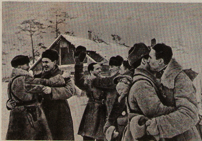
Фото 1943 года.