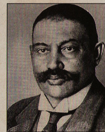
Евно Азеф был руководителем Боевой организации эсеров и одновременно — агентом царской охранки

узко партийный догматиком он не был, Россию любил. Бывший «охотник на губернаторов» на посту управляющего военным ведомством отстаивал необходимость укрепления армии. Большевики гибли случайных людей? Надо ли убивать царя — ведь убийство народовольцами Александра II, наоборот, вызвало среди крестьян толки, что «дворяне убили государя», отменившего крепостное право?.. Для Савинкова все это было не досужими рассуждениями, а важными вопросами бытия. Оружием террористов были не только традиционные бомба,