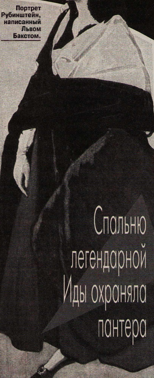
Портрет Рубинштейн, написанный Львом Бакстом.

В ее парке клумбы в особых, придуманных Бакстом, лотках, которые путем перестановки меняют садовый ландшафт каждые несколько недель. А еще есть фонтаны, выложенные мозаикой тропинки и даже маленький зоопарк с обезьянами, павлинами. Иногда к гостям выводят люби-