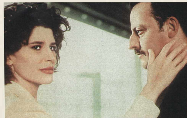
Фанни Ардан и Жан Рено в мелодраме «Над облаками»