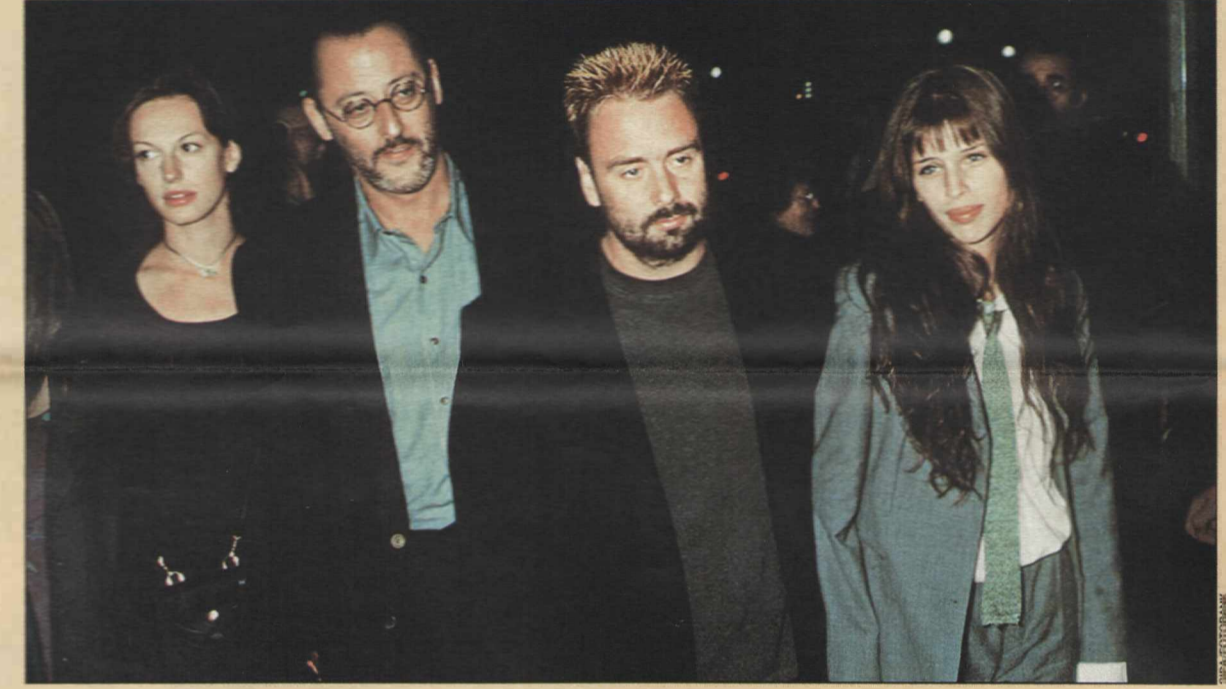
Жан Рено и Люк Бессон с друзьями на премьере боевика «Леон» в Париже. 1994 г.