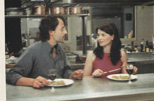
С Жюльетт Бинош в фильме «История любви»

— Если бы сегодня Люк Бессон предложил мне сыграть Виктора-чистильщика из фильма «Ее звали Никита», я бы точно — при всем моем уважении к этому человеку — отказался. Я вообще больше не снимаюсь в ролих персонажей, вызывающих страх и отторжение, какой бы гонорар мне ни предлагали. И не оттого, что деньги не имеют для меня никакого значения. Просто не хочу, чтобы мои зрители путались, а я им объяснял, что сам я не такой, что кино — это выдумка. — считает звезда французского кино Жан Рено, прославившийся исполнением роли киллера Леона в культовом боевике Бессона. Наш разговор состоялся в Париже во время Ежегодной встречи с французскими кинематографистами. В минувшем году самым крупным дистрибутором французского кино оказалась Россия. Так что у нас есть все шансы в скором времени увидеть в прокате множество новых французских лент, в том числе и с участием Жана Рено. — Вот так откажетесь от ролей раз-другой, а потом и вовсе предлагать перестанут. Не боитесь? — К 54 годам я понял, что кино больше не играет в моей жизни такую важную роль, как раньше. Стран-