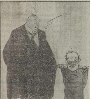
А. К. Глазунов и Цезарь Кюи.