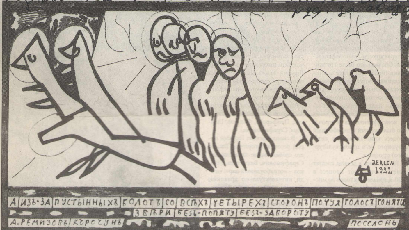
«Волки, миши и курицы/ А из-за пустынных болот со всех четырех сторон почуяв голос гонятся / звери без – попятю без – завороту».

Независимая - 2004 - 5 авг - с. 4 - ИГ / В. А. Ремизов