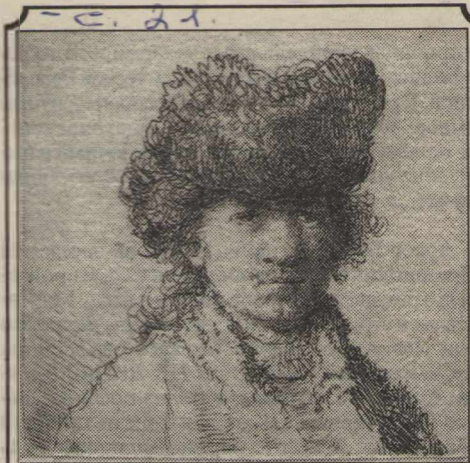
Рембрандт. Автопортрет с пером. 1634