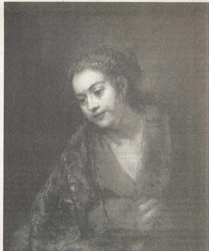
и "Портрет Хендрике Стоффелс". 1660 г.