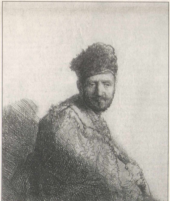
Рембрандт. "Бородатый мужчина в меховой шапке и вышитом плаще" (Портрет отца Рембрандта). 1631 г. (слева)