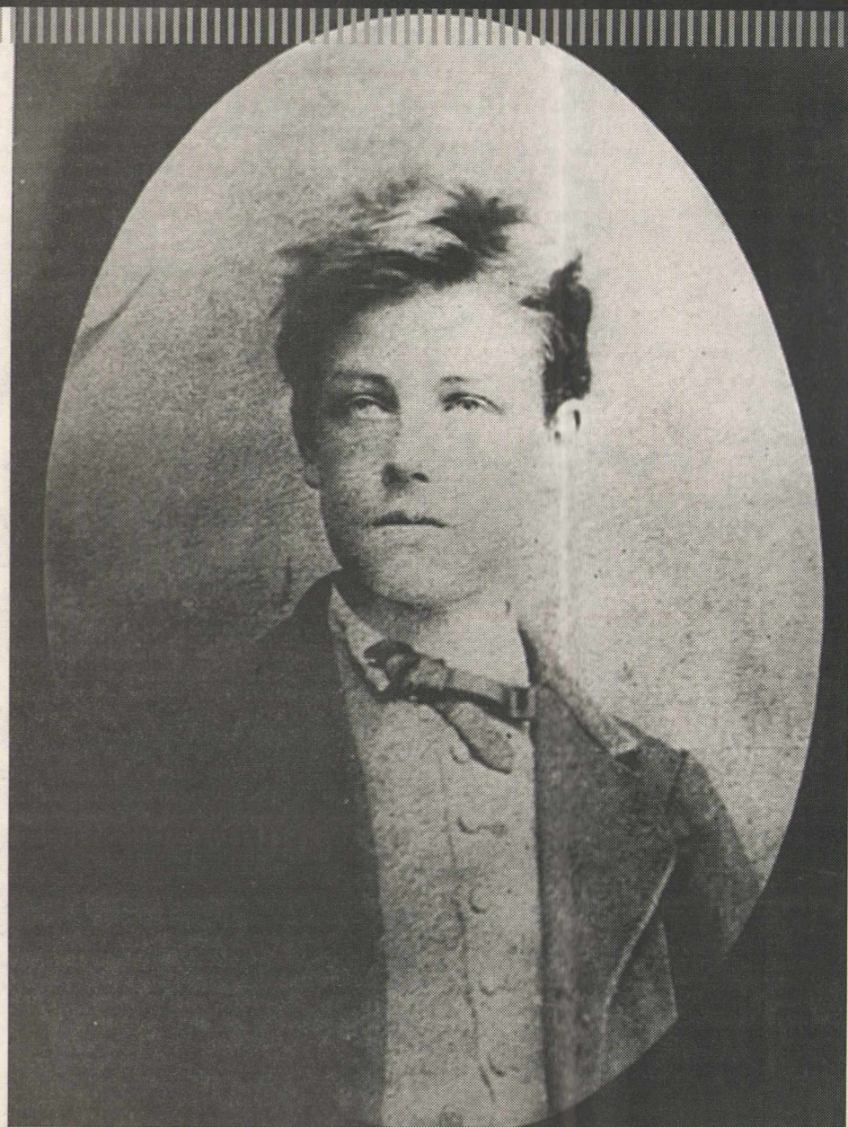
Артур Рембо в 16 лет: классическая фотография 1870 года

Жан Никола Артур Рембо родился 20 октября 1854 года во французском городке Шарлевиль в семье военного. В школе Артур был одним из самых блестящих и прилежных учеников. Первые строчки Рембо срифмовал в восемь лет, а в четырнадцать уже увидел свои стихи опубликованными. В том же возрасте меняет характер Рембо. Он сбегает из дома, попадает в тюрьму, начинает себя вести экстравагантно и грубо. Именно таким узнал Артура поэт Поль Верлен, которому в августе 1871 года Рембо отправил письмо с рукописью «Пьяного корабля». У них начинается бурный роман, из-за которого Верлен бросает семью. В 1873 году во время обычного для них скандала Верлен ранит Рембо из пистолета и попадает в тюрьму. После разрыва с Верленом Рембо больше не писал стихов. Он много путешествовал, добрался даже до Африки, где и заболел саркомой. В мае 1891 года Рембо ампутировали правую ногу, но это его не спасло и 10 ноября он умер. Похоронен Артур Рембо в Шарлевиле.