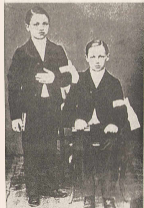
Первое причастие Артюра Рембо (слева — старший брат поэта, Фредерик)