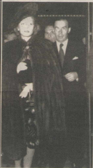
Ремарк с Марлен Дитрих в Лос-Анджелесе, 1939 год.

Это было мягко сказано. С отвращением, с подавляемым чувством омерзения Ремарк вернул издательству поправленный экземпляр, пишет он в своем дневнике. Он считал, что Германия встала на путь реставрации старых порядков. Это приводило его в отчая-