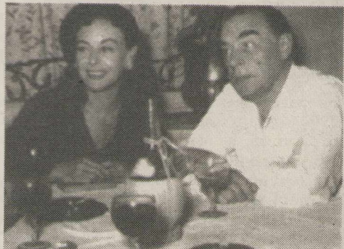
В 1958 году писатель женился на голливудской актрисе Полетт Годар.

Впрочем, Эрих Мария Ремарк вообще не очень нравился своим соотечественникам. Ожесточенные споры вызвал уже первый его роман. «На Западном фронте без перемен», где полу-