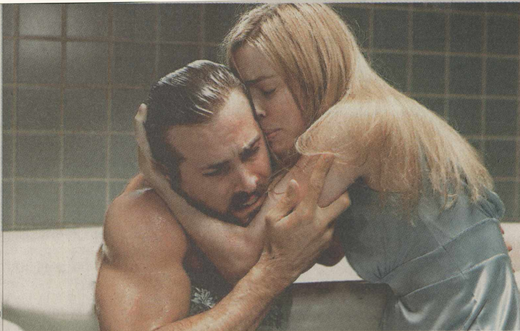
Герой Райана Рейнольдса в фильме «Ужас Эмитивилля» теряет рассудок и изводит семью приступами бешенства