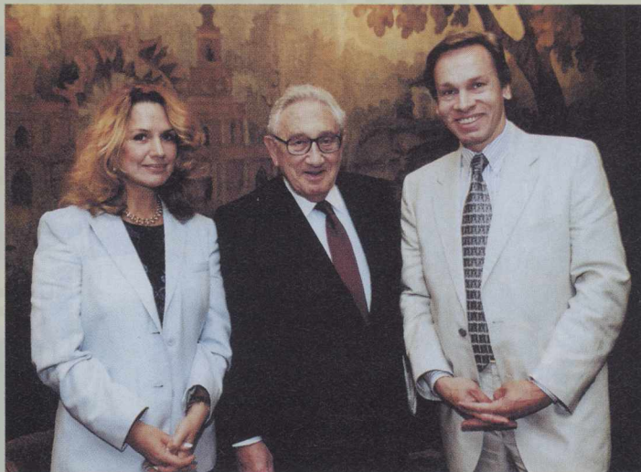
С супругой Ниной на приеме у бывшего госсекретаря США Генри Киссинджера (в центре).

В квартире Пушкиных чувствуется любовь к антикварным вещам. Да вот, кстати, и книга по истории Африки в руках ведущего датируется, между прочим, XIX веком.