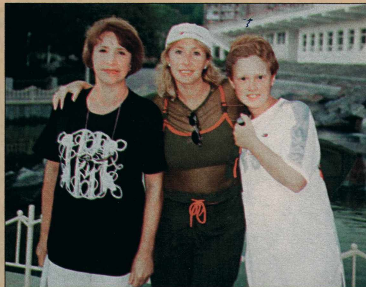
2000 год. С мамой и сыном на детском кинофестивале в «Орленке»

водится на телевидении, получилось это случайно. Однажды мы сняли историю с Лидией Федосеевой-Шукшиной, но весь ее текст оказался в браке. Перезаписать интервью было невозможно, как невозможно повторить исповедь. Пришлось мне самой рассказывать ее историю. После выхода программы этот ход сочли интересной находкой, достойной продолжения. Прошло совсем немного времени, и мои интонации стали откровенно копировать коллеги. Замечу: что на американском телевидении, напротив, все ведущие женских программ работают в другой манере — жесткой и деловой.