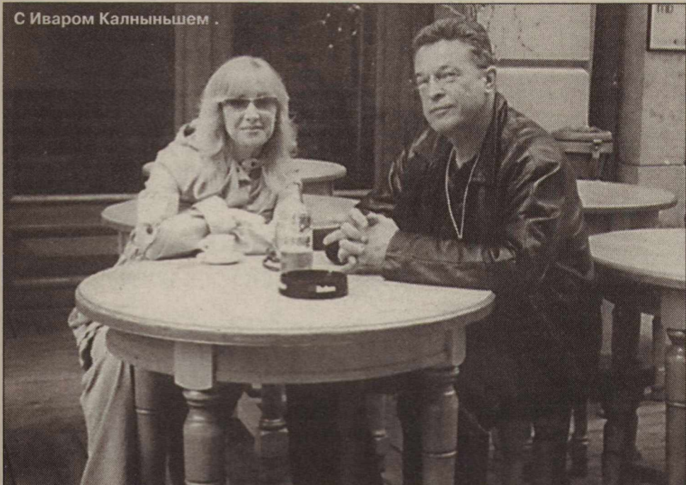
С Иваром Калныньшем

Оксана Пушкина в представлении не нуждается. Каждый из нас непременно видел хоть один выпуск ее программы. К Пушкиной и к тому, что она делает, можно относиться по-разному, но то, что она – человек с железным характером и потрясающей работоспособностью, сомнению не подлежит. Помимо телепрограмм Оксана успевает писать книги о героях своих передач. Недавно в издательстве «ЭКСМО» вышла ее новая книга «Испытание судьбой». Собираясь на это интервью, я точно знала, какой вопрос задам первым.