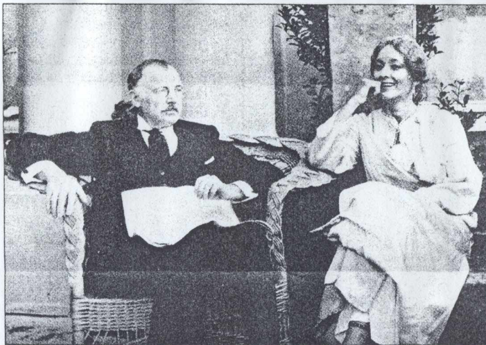
Кадр из фильма «Кража»

— Смоктунувский, приходя в студию, снимал туфли и надевал тапочки. Ну, во-первых, у нас без конца трещали половицы: «Ах, шум, треск... останавливаем, так же нельзя!» Но главное, мне кажется, он чувствовал себя в тапочках как дома, наедине с собой. И эта келейность помогала ему общаться со слушателями душа в душу.