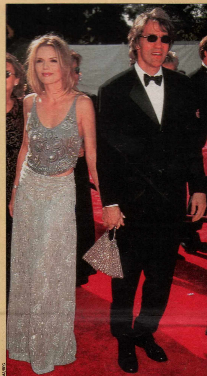
МИШЕЛЬ ПФАЙФФЕР: «ГЛАВНОЕ НЕ ПЕРЕБОРЩИТЬ!» С МУЖЕМ ДАВИДОМ КЕЛЛИ. ЦЕРЕМОНИЯ ВРУЧЕНИЯ ПРЕМИИ «ЭММИ». ЛОС-АНДЖЕЛЕС, 1998 г.

Голливудская звезда утверждает, что к этой «стильной идиллии» ее привела та самая первая восторженная реакция модных критиков. Но и тут вряд ли дело обходится без кокетства: как бы смогла Пфайффер стать стильной по указке газетных статей? Да и кто бы смог, не обладая в придачу к мнению критиков еще и превосходным собственным вкусом?! Мишель изобрела, а скорее — доказала жизнеспособность и актуальность своего стиля, следовать которому — проще некуда. Все должно быть гармонично и без излишеств. Главное — не переборщить! Применительно к Пфайффер это — аксиома, не требующая доказательств. Ни