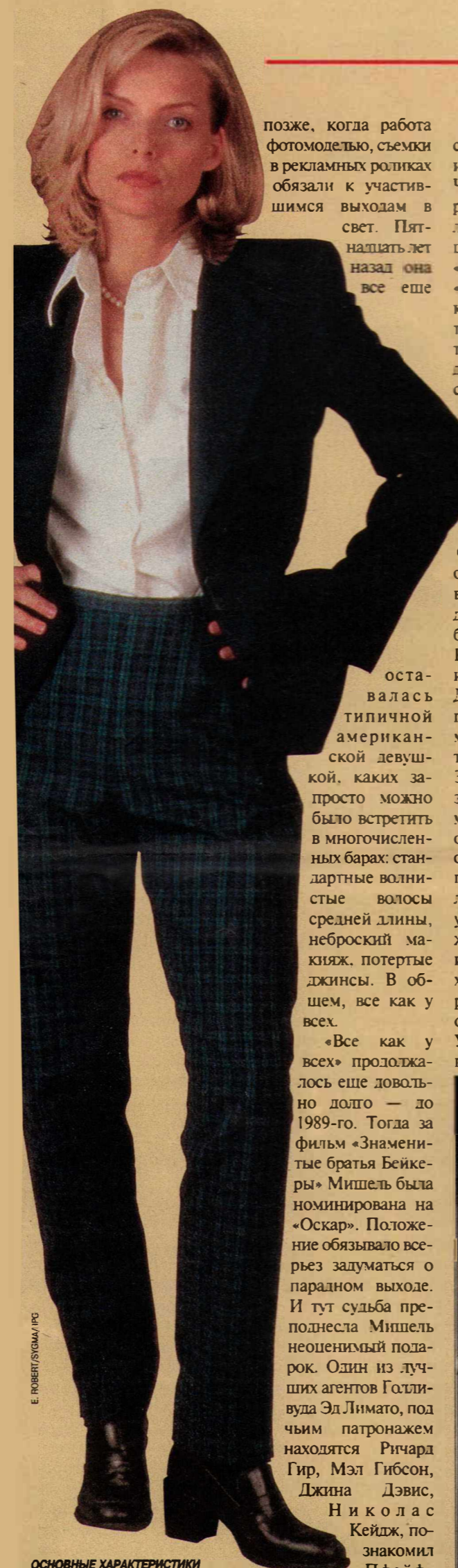
ОСНОВНЫЕ ХАРАКТЕРИСТИКИ И СТИЛЯ ПФАЙФФЕР, И СТИЛЯ АРМАНИ: КЛАССИЦИЗМ, ЛАКОНИЧНОСТЬ И УМЕРЕННОСТЬ

позже, когда работа фотомоделью, съемки в рекламных роликах обязали к участвующимся выходам в свет. Пятнадцать лет назад она все еще