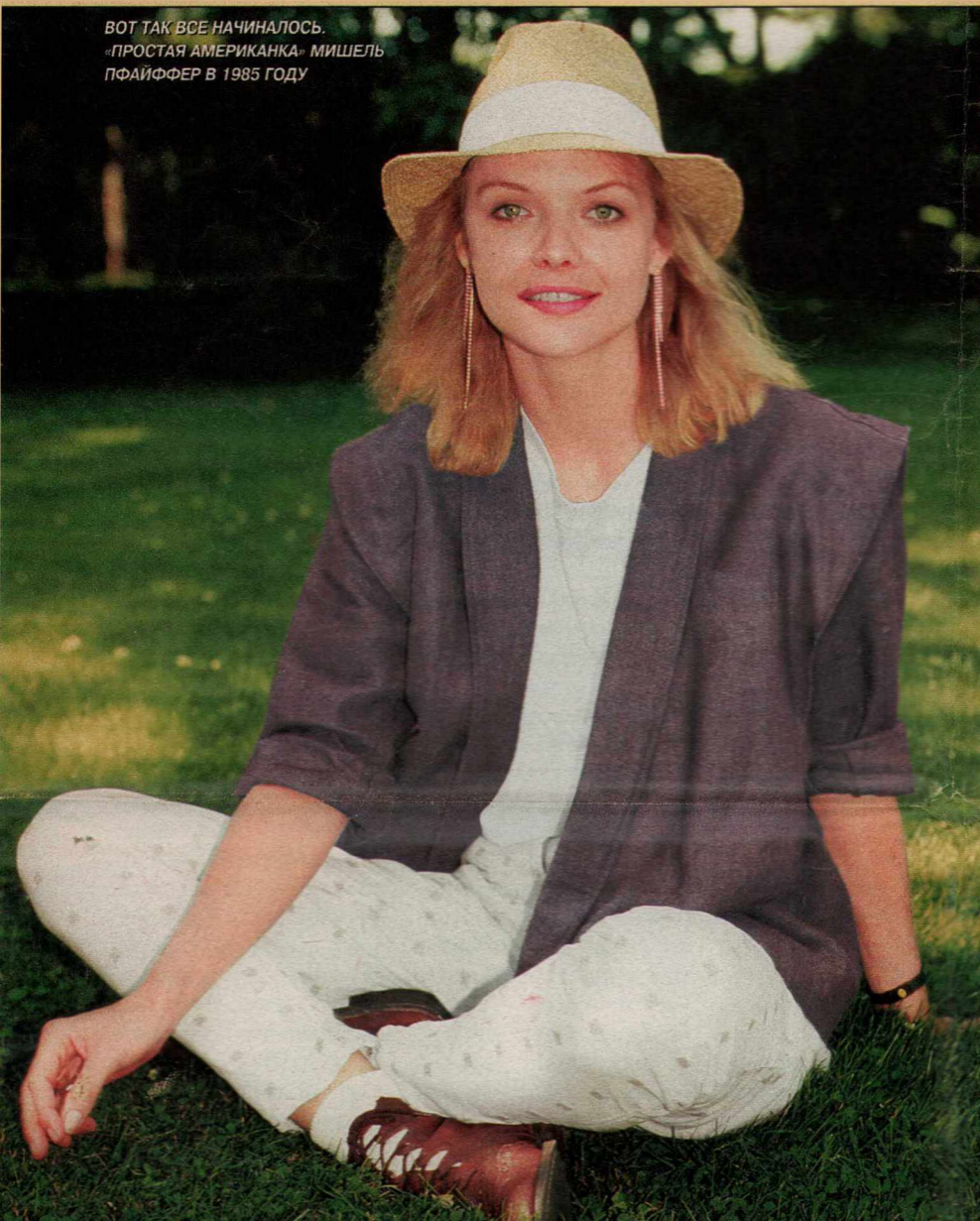
ВОТ ТАК ВСЕ НАЧИНАЛОСЬ. «ПРОСТАЯ АМЕРИКАНКА» МИШЕЛЬ ПФАЙФФЕР В 1985 ГОДУ

Признайтесь честно, зачастую мы находим гораздо более интересным обсуждение внешности и нарядов кинозвезд, чем собственно их ролей. И кинозвезды об этом знают, можете не сомневаться. Иначе не стремились бы так попасть в заветные ежегодные списки: десятку самых красивых людей планеты. Или самых сексуальных. Или самых стильно одетых. Если сравнить все эти первые десятки «самых-самых» в Голливуде, то выяснится, что лишь одно имя объединяет верхние строчки всех «чартов». Это имя Мишель Пфайффер.