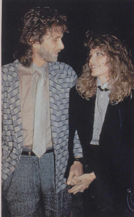
Первый муж — Питер Хортон