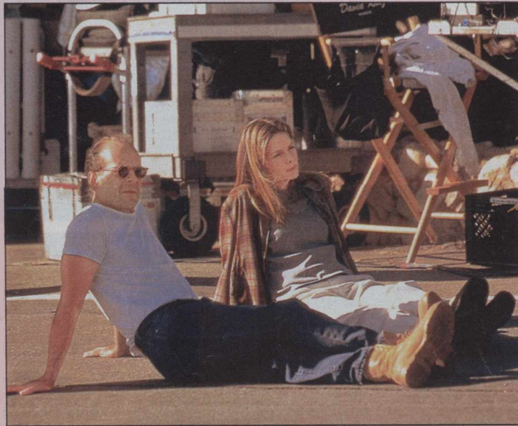
С Брюсом Уиллисом. Кадр из фильма «История о нас»

Мишель сидела в машине уже минут сорок. Мимо то и дело проносились лимузины — звезды разной вели-