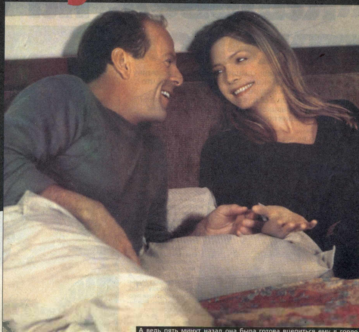
А ведь пять минут назад она была готова вцепиться ему в горло