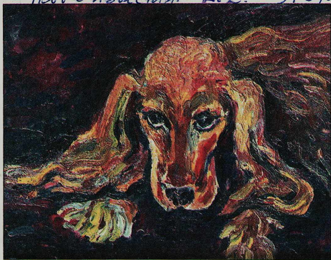
Владимир СОКОЛОВСКИЙ, для «Новых Известий»

Новые Известия. — 2002. — 31 янв. — с. 6.