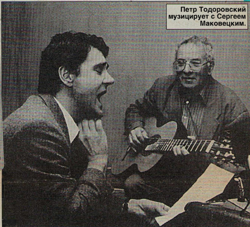
Петр Тодоровский музицирует с Сергеем Маковецким.

ТОДОРОВСКИЙ Петр Ефимович родился 26 августа 1925 года. В 1943 году ушел на фронт. В 1954 году окончил операторский факультет ВГИКа. В качестве оператора снял фильмы Марлена Хуциева «Два Федора» и «Весна на Заречной улице», как актер сыграл у него в фильме «Был месяц май». В 1965 году выступил как режиссер фильма «Верность» по сценарию, написанному совместно с Булатом Окуджавой (фильм получил приз «Опера Прима» в Венеции за лучший дебют). Поставил ленты «Фокусник», «Городской романс», «Своя земля», «Последняя жертва», «По главной улице с оркестром», «Ретро втроем». Начиная с «Военно-полевого романа» пишет музыку ко всем своим фильмам.