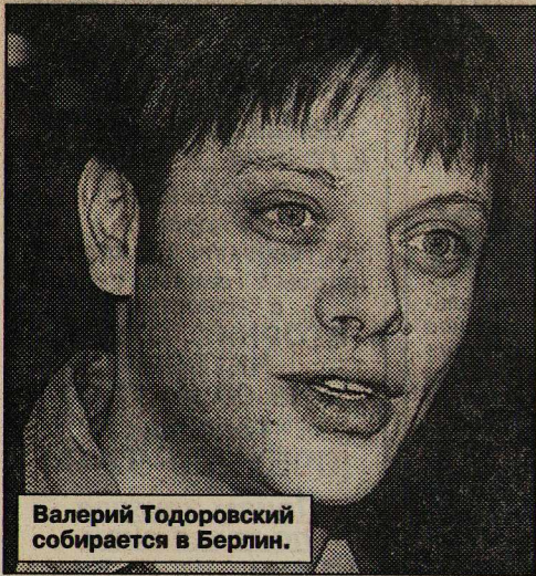
Валерий Тодоровский собирается в Берлин.